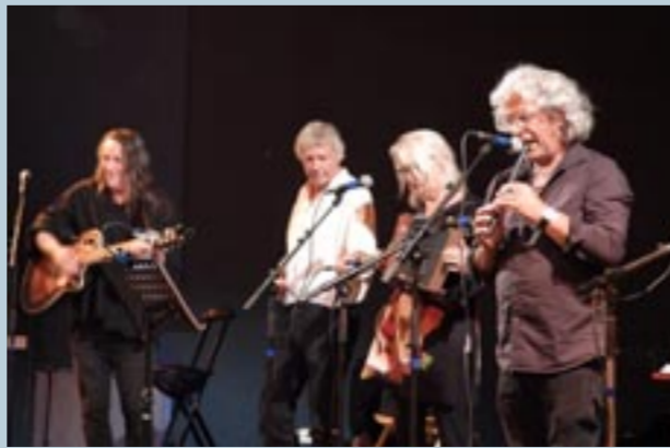
Le groupe Caboulot → sous chapiteau