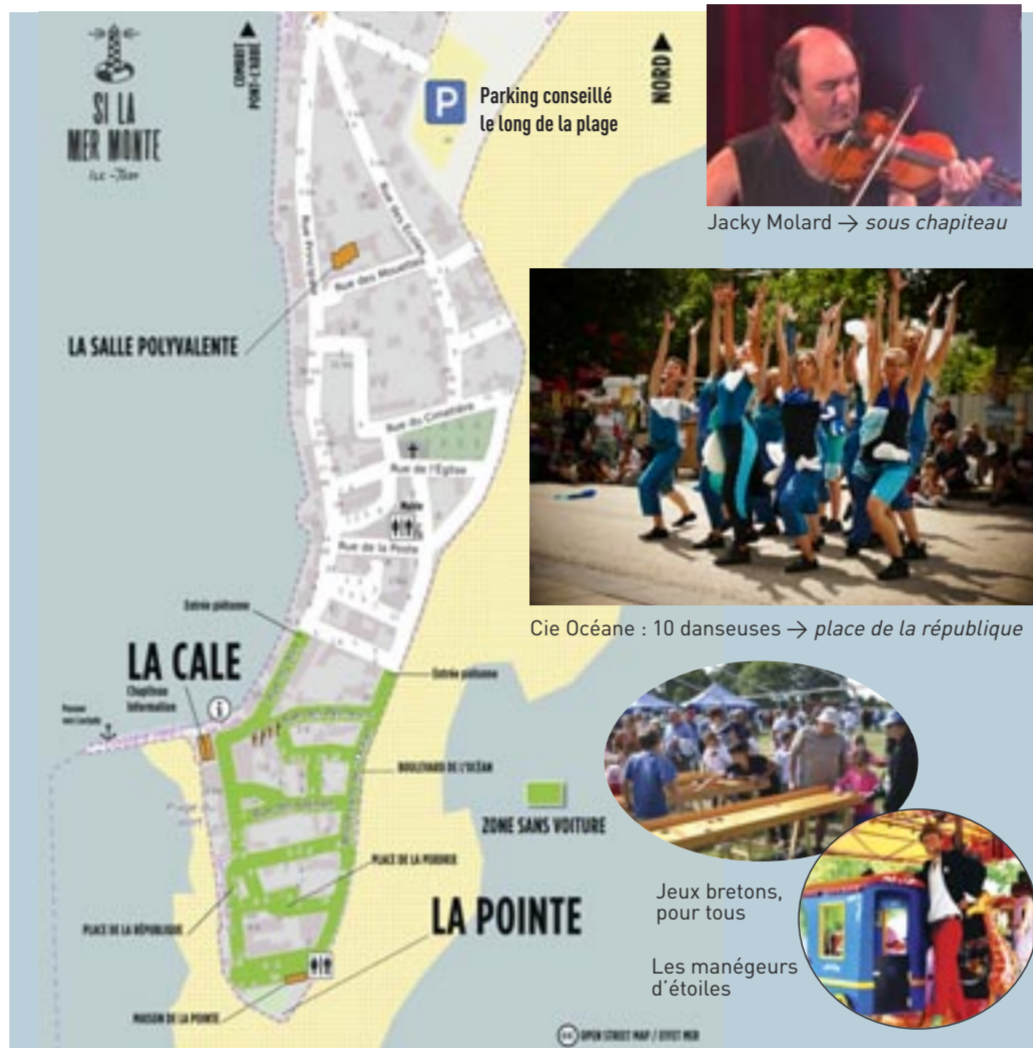
Cie Océane : 10 danseuses → place de la république