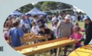
Jeux bretons, pour tous