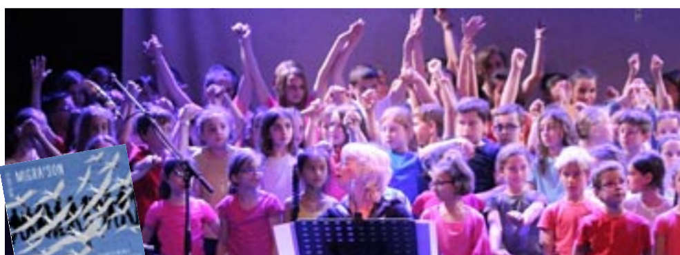
Chorale Migra'son → sous chapiteau