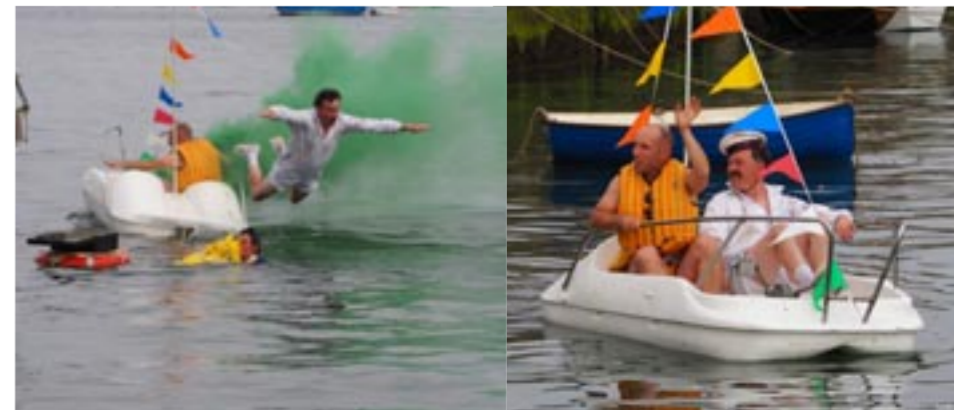
La Compagnie Orange Givrée : Les croisières BERNIKA → bld de l'Océan