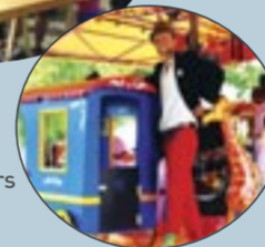
Les manègeurs d'étoiles