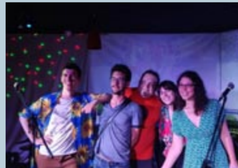
Le groupe Faks → place de la république