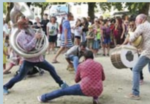
Fanfare GrOve → partout