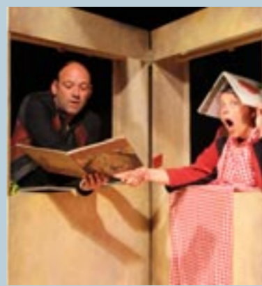
Pop Up Un grand livre totem